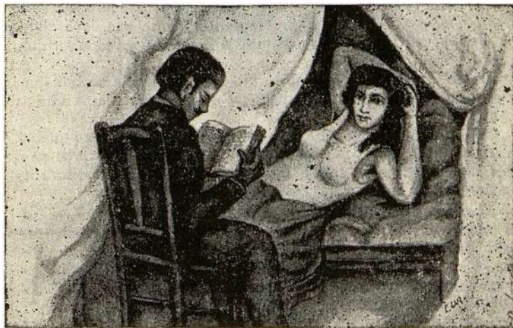
Leyendo al Baroncillo de Faublas. . .