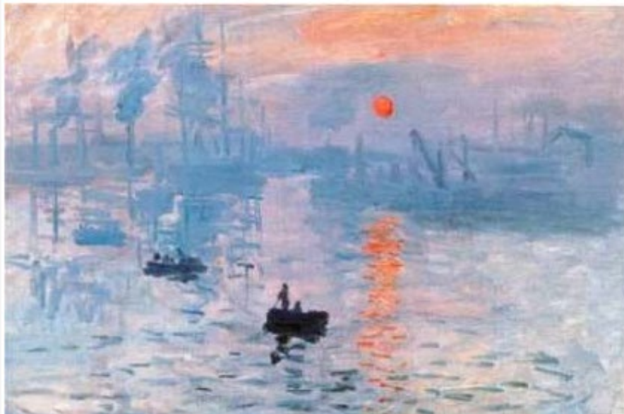
Claude Monet, Impresión, sol naciente, 1872.

de ellas se utilizó el título de la obra de Monet "Impresión", como una descripción despectiva de lo que el crítico describió como la naturaleza "inacabada" de su pintura. A partir de allí el grupo de artistas adoptó desafiantemente el término "impresionista" para describir su trabajo, y la palabra se convirtió en el nombre del movimiento.